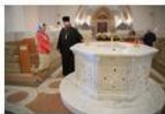
Опыт работы СЕВАСТОПОЛЬСКОГО БЛАГОЧИНИЯ с молодежью