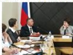
Доклад УПР Ярославской области: «Проблемы патриотического воспитания детей в современной России. Опыт Ярославской области».