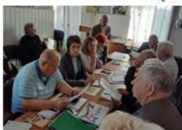
Круглый стол по вопросам патриотического воспитания учащихся школ города Севастополя.