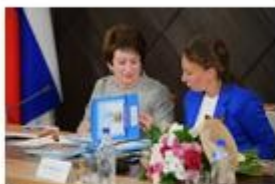
Проекты в городе Севастополе: «Дневник севастопольского школьника» Образовательный курс «Севастопольведение»