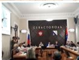
Доклад директора Департамента образования и науки города Севастополя и УПР в городе Севастополе: «Проекты в сфере воспитания гражданственности и патриотизма детей в городе Севастополе».