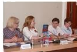
Доклад УПР Калужской области «Проект «ЮНАРМИЯ Наставничество» как основа патриотического воспитания детей-сирот и детей, оставшихся без попечения родителей».