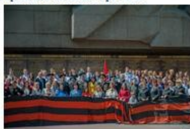
Всероссийская акция «Георгиевская ленточка»