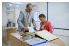
Проект Батарейная школа музейного комплекса «35-я береговая батарея»

Становление активной гражданской позиции членов Детского совета, их патриотическое воспитание осуществляется посредством планомерной методической работы через конкретные мероприятия и проектную