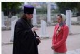
Опыт работы СЕВАСТОПОЛЬСКОГО БЛАГОЧИНИЯ с молодежью