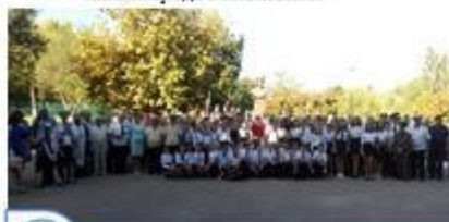
Торжественное открытие бюста дважды Героя Советского Союза В. Д. Лавриненкова в ГБОУ "СОШ № 43 с углубленным изучением английского языка имени дважды Героя Советского Союза В. Д. Лавриненкова"