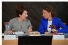
Проекты в городе Севастополе: «Дневник севастопольского школьника» Образовательный курс «Севастополеведение»