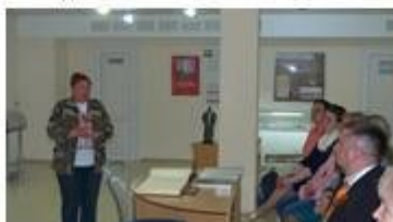
Проект Батарейная школа музейного комплекса «35-я береговая батарея»