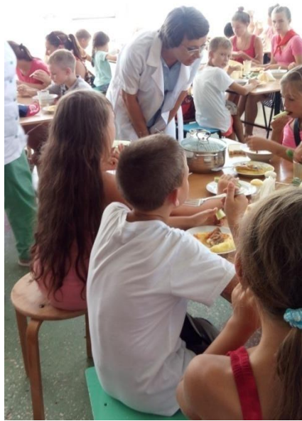
Фото - Уполномоченный по правам ребенка в городе Севастополе беседует с детьми, отдыхающими в ДОЦ «Ласпи»

Во время посещения лагерей также осматривались помещения для работы детских спортивных секций и творческих кружков, жилые корпуса и столовые, в том числе пищеблок ДОЦ «Ласпи», возобновивший свою работу 13.07.2018 после устранения нарушений.