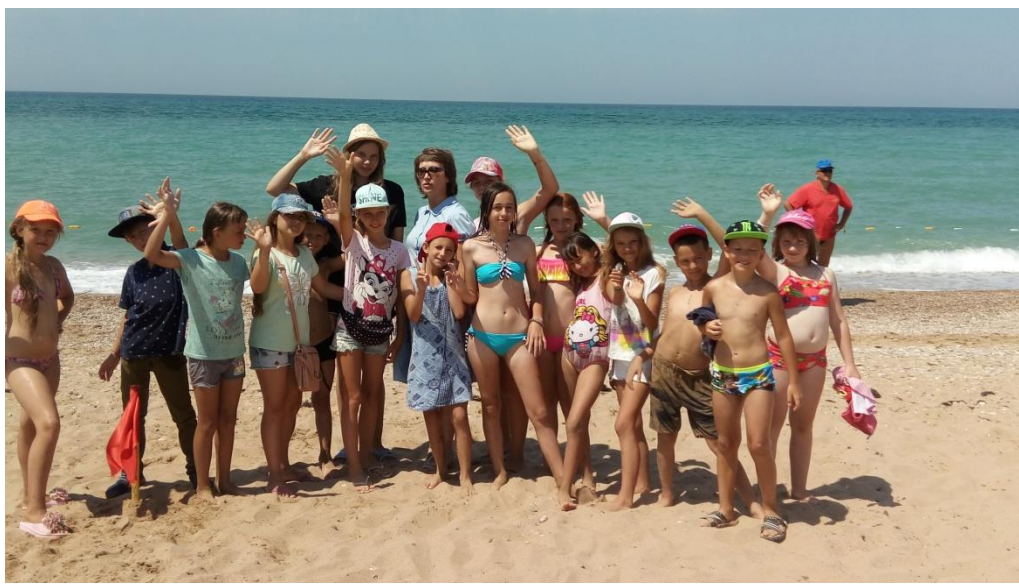
Фото - пляж детского оздоровительного лагеря «Нахимовец» с. Орловка

Купание детей в детском оздоровительном лагере – одно из самых важных для оздоровления детей мероприятий. Уполномоченный по правам ребенка в городе Севастополе уделила этому вопросу особое внимание, осмотрев места купания детей. В каждом детском оздоровительном лагере (исключение ДОЛ «Горный») директорами и обслуживающим персоналом соблюдены требования к местам купания детей.